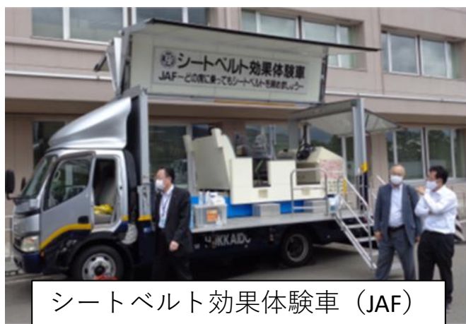
シートベルト効果体験車 (JAF)