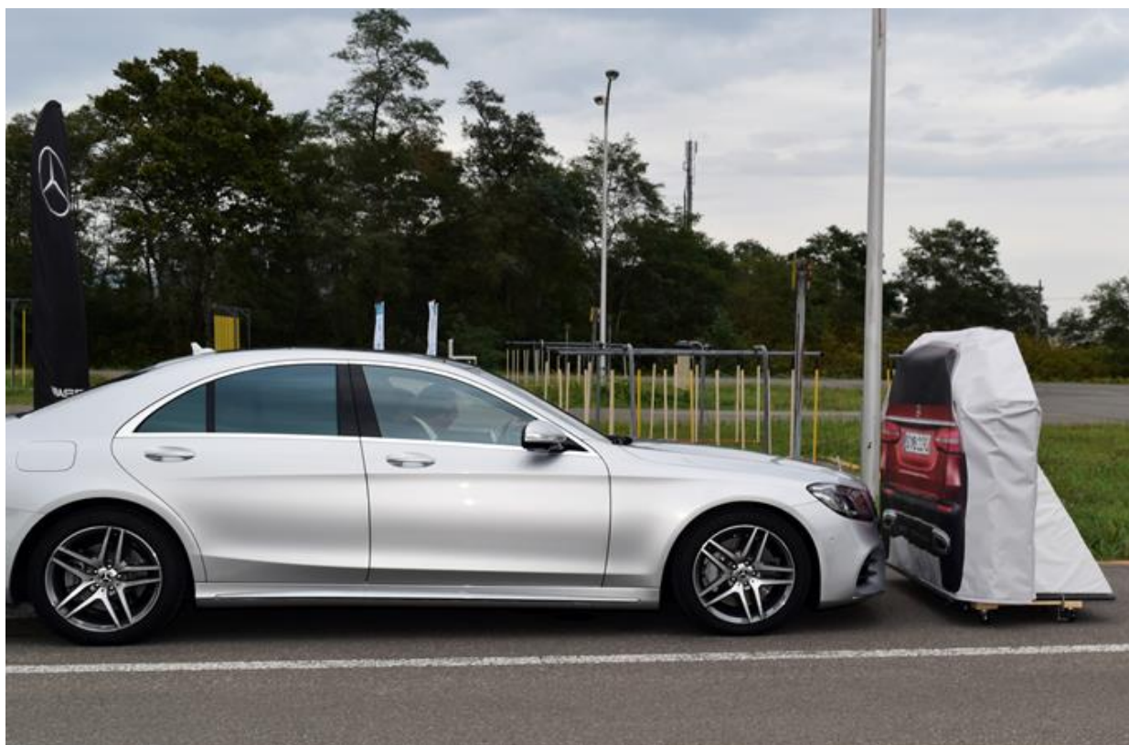
2019年実施時の写真（「衝突被害軽減ブレーキ」の体験風景）